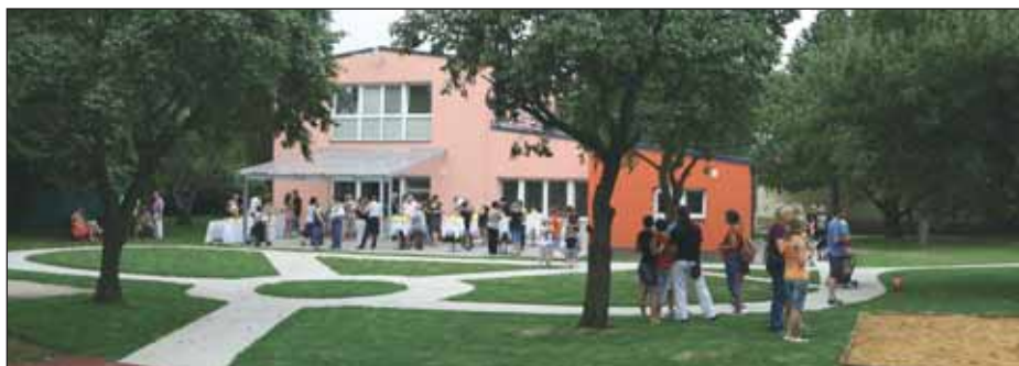
Do prostorné zahrady se vešlo i dopravní hřiště.

Stav objektu byl po téměř šedesáti letech užívání zcela nevyhovující, toho si byla