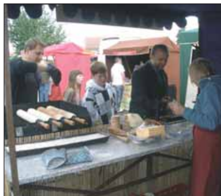
O tom, že oblíbené trdelníky chutnají dětem i dospělým, svědčí i naše fotografie.

Je zřejmé, že se vedení čakovické radnice podařilo uspokojit poptávku místních po možnosti nakoupit všemožné dobroty a čerstvou sezónní zeleninu či ovoce přímo