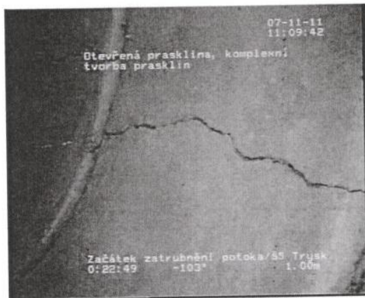
Třeboradický potok, praskliny