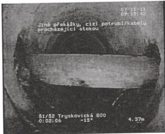
Třeboradický potok, překážky ve stoce