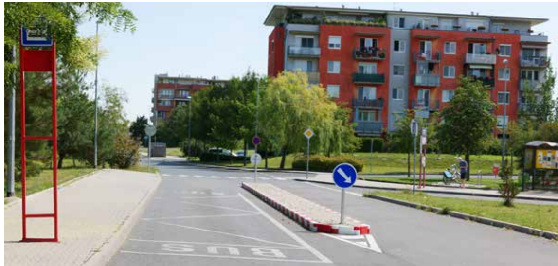
změna přednosti v jízdě v lokalitě Marie Podvalové

Na svých pravidelných zasedáních Rada městské části Praha-Čakovice projednala několik bodů jednání. Vybíráme pro vás některé z nich.