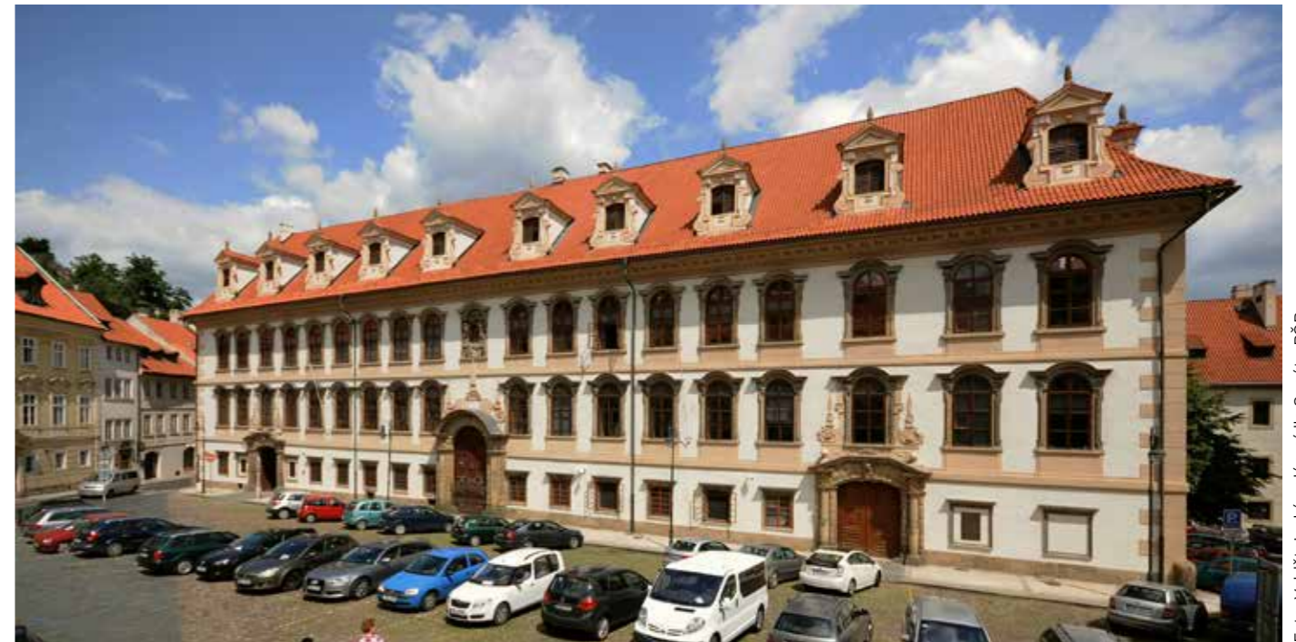
Foto: Valdeštejský palác, sídlo Senátu ČR

Poznámka redakce: Více o projektu se dozvíte na www.cakovice-zitra.cz .