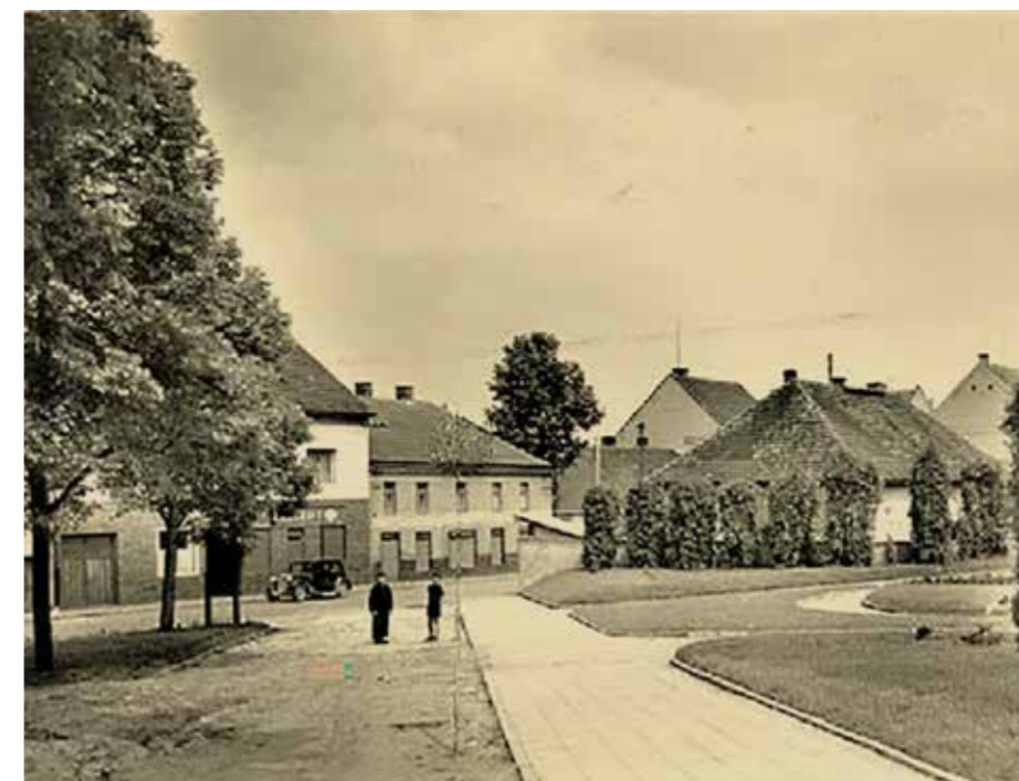
Čakovice