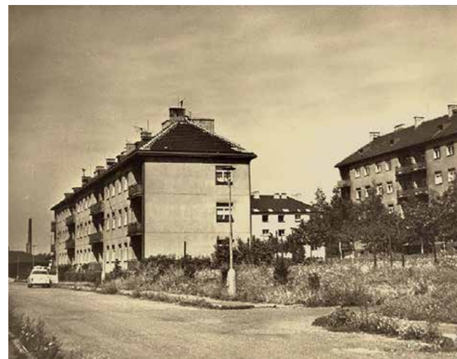
Bytové jednotky n.p. Avia

Z kronikových zápisů Františka Mlejníka a Jana Širce