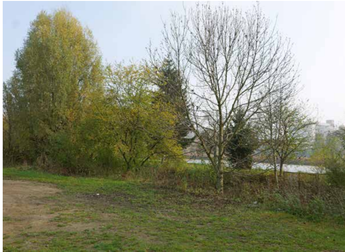
Foto: prostor u Cukrovarského rybníka před revitalizací

Na svých pravidelných zasedáních Rada městské části Praha-Čakovice projednala několik bodů jednání. Vybíráme pro vás některé z nich.