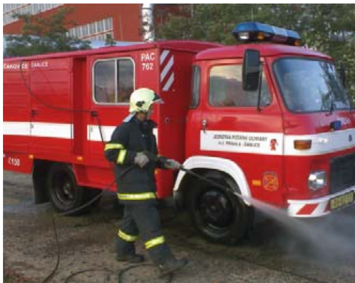
Pravidelná údržba je nezbytná

Jak jsme minule slíbili, rádi bychom vás v dnešním článku seznámili s naší mobilní technikou. Jelikož by veškerá naše technika zabrala celé vydání tohoto měsíčníku, vybrali jsme dnes technický