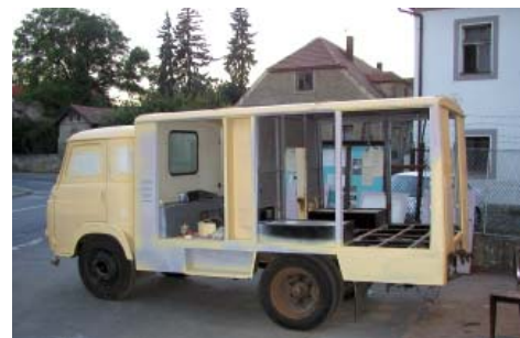
Avia v novém kabátě

drží na vodu o obsahu 750 litrů a čerpadlem a výtlačku 20 litrů za sekundu. Díky těmto prostředkům je možné uhasit již automobil. V nástavbě vozu můžeme nalézt nutný zdravotnický materiál, ale také lezeckou techniku. Když je potřeba si posvítit, je v Avii umístěna elektrocentrála 220/380 V – 4 Kw. Díky dotaci od magistrátu hl. m. Prahy jsme zakoupili rozbrus, a tak se už můžeme dostat k lidem uvězněným v automobilu, skrz beton nebo železnou konstrukce. Střecha nástavby slouží jako držák pro raft. V prostoru pro mužstvo jsou umístěny 4 dýchací přístroje Saturn s 2 ks náhradních lahví. Jako každé správné hasičské vozidlo má i Avia majáky a houkačky. Vozidlo se průběžně vylepšuje.