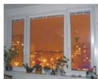
...nové okno VEKRA