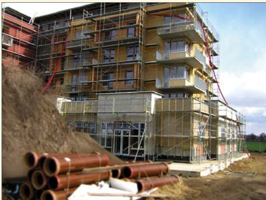
Do září by měla být nová mateřská školka hotová