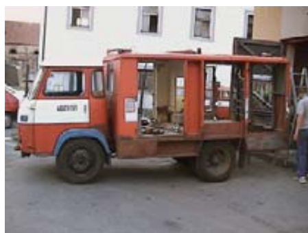
Původní podoba se s tou dnešní nedá srovnat

ho roku výroby, chtěli jsme rekonstrukci pojmout moderně. Každý dnešní zásahový automobil má k dispozici nádrž s vysokotlakým čerpadlem, proto velkou inovací bylo osazení nástavby plastovou ná-