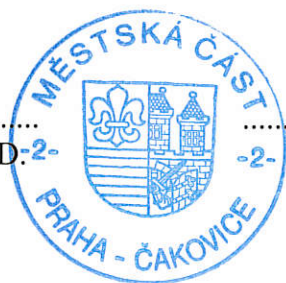
Bc. Blanka Klimešová -2- zástupce starosty