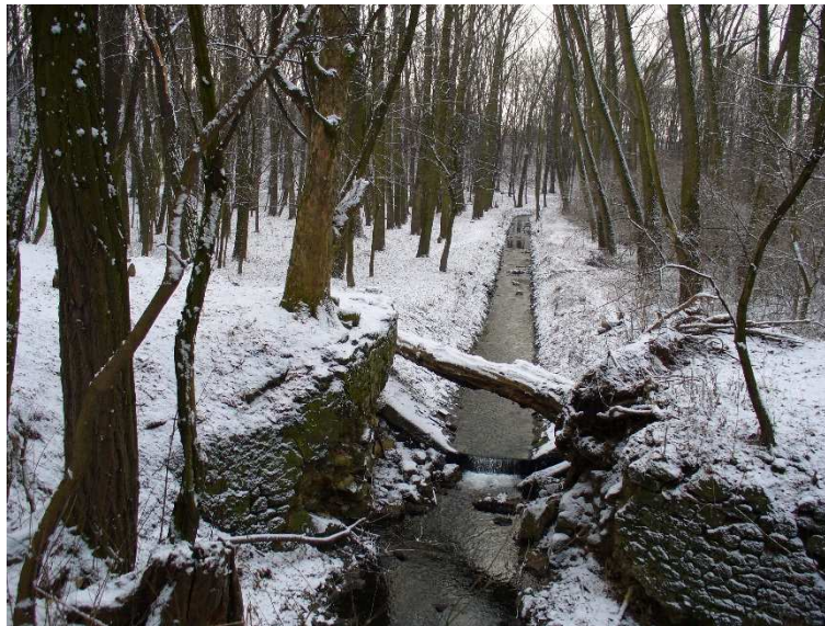
obr. 2 – úsek 01, pohled od bývalé hráze proti proudu

Přístup na stavbu je navržen z ulice Polabské zřízením dočasného příjezdu. V rámci stavby bude nutné pokácet několik stromů.