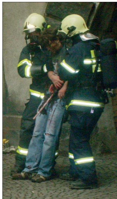
Figuranti v roli zraněných byli namaskováni opravdu věrohodně. Předvedli výkony, za které by se nemuseli stydět ani profesionální herci. Stejně dobře si ovšem vedli i hasiči při jejich záchraně.

Vidět tyto hasiče v akci, nikdo už je nebude nikdy srovnávat s rádo by hasiči ze známého filmu Hoří, má panenko. (šv)