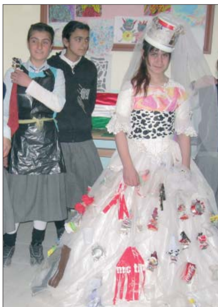
Zužitkovat odpadky se dá různými způsoby, i jako materiál pro výrobu šatů.